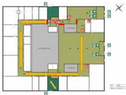
ETAGENPLAN OBERGESCHOSS 1

Aufsichtsführung durch Aufsichtsperson 1 im gelb gekennzeichneten Bereich Ende des Schulgebäudes an den rot gezeichneten Balken